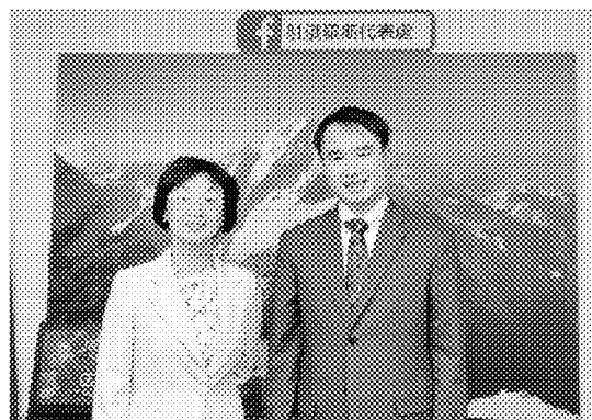
▲ 施養隆拜會駐俄羅斯代表處羅代表靜如