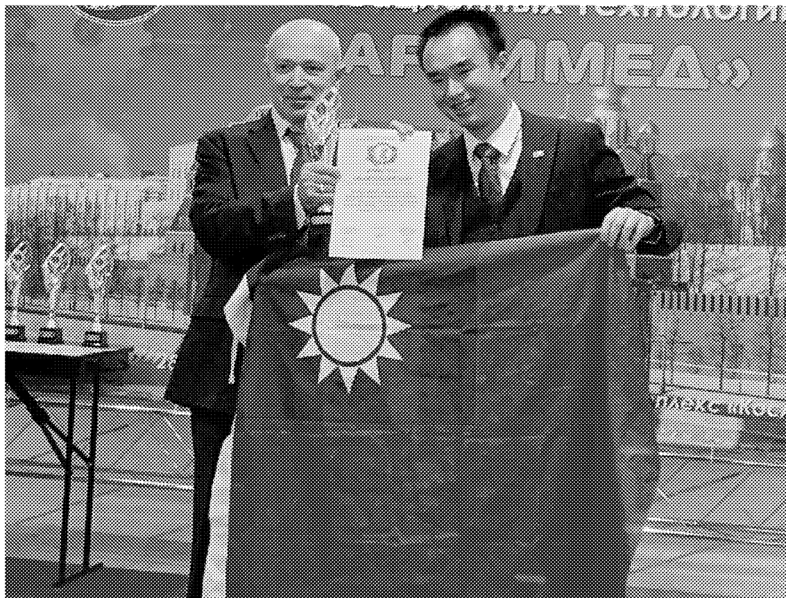
▲ 大會主席 Dmitry Zezyulin 頒發獎項給 TIPPA

格外珍貴的是，參展團隊成員橫跨教育研發單位、生醫界大廠等，作品類別包含生技、醫療、農業技術、生活用品等，創造力豐盛多元，是非常具潛力與實踐力的發明協會，相當期待TIPPA未來帶領更多作品再闖俄羅斯與世界發明平台！