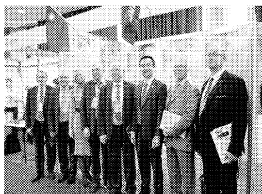
▲ 當地廠商蒞臨台灣展區洽談合作