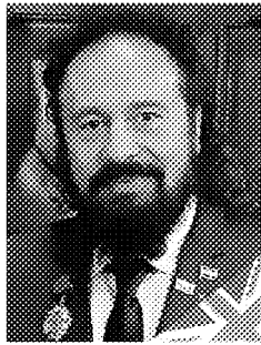
President of the International Jury