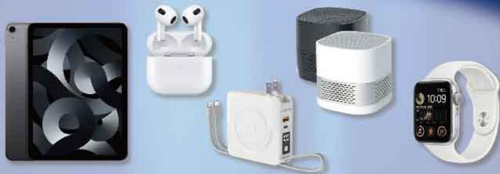
<獎品以現場實際為主>